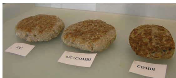
Hamburgaren längst tv är stekt i en kontaktstek, den i mitten först i kontaktstek, därefter i kombiugn och den längst th enbart i kombiugn.

Den traditionella konvektionsugnen kombineras också ofta med en fritös eller kontaktstekare. Den är annars mest avsedd för produkter i tråg, som lasagne och gratänger.