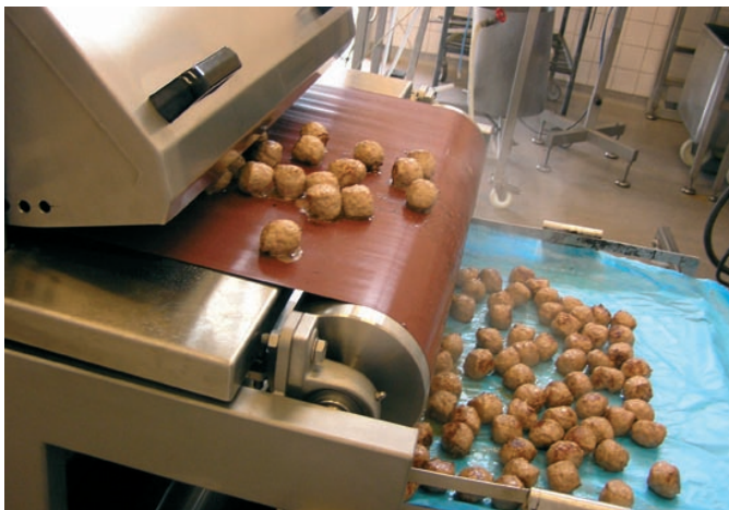
Köttbullar som steks i kombiugnen behöver inte friteras innan.