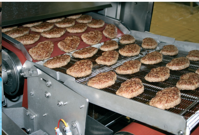
Hamburgare får ett lite mer hemlagat utseende när de steks i kombiugnen.